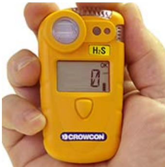
Зураг 2: Хувийн хүхэрт устөрөгч илрүүлэгч

Хувийн хамгаалах хий илрүүлэгч нь овор багатай, хөнгөн, үйлдвэрийн хүнд нөхцөлд ашиглахад зориулагдсан бат бөх багаж юм. Хэрэглэхэд хялбар, хийн агууламжийг төвөггүй харах боломжтой том дэлгэцтэй, хүхэрт урсгөрөгч хийн агууламж заасан хязгаарт хүрмэгц дуу болон чичиргээтэй, дүрст дохио өгдөг.