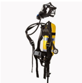
Зураг 3: SCBA Агаар дамжуулах систем

ӨААА-ыг хэрэглэгч нь савнаас маск руу очих агаарыг амьсгалах замаар цэвэр агаар бүхий орчныг уг төхөөрөмжийн тусламжтай бий болгодог. Өндөр даралт бүхий агаар агүүлж буй сав нь 1 цаг хүртэлх хугацаанд хангалттай агаараар хангах ба үүнээс том хэмжээтэй нь илүү удаан хугацаанд агаараар хангана.